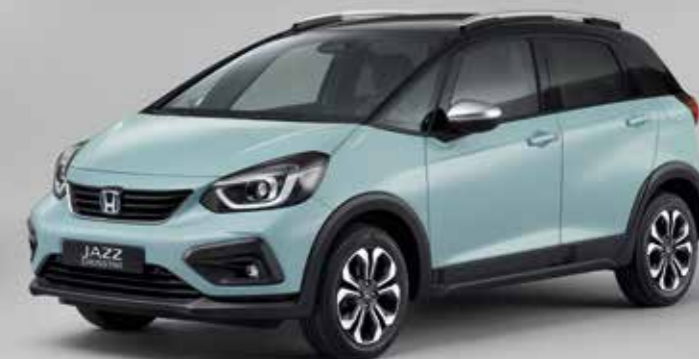
SURF BLUE / TWO-TONE