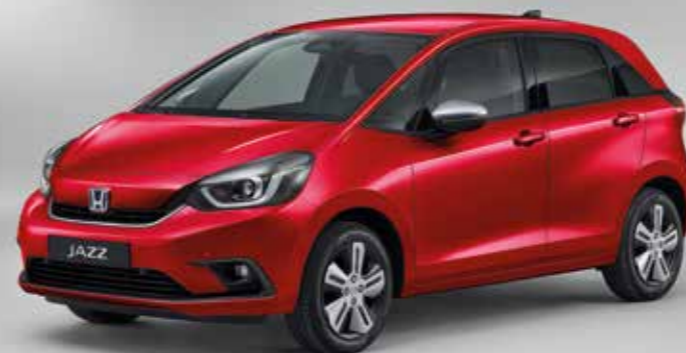
PREMIUM CRYSTAL RED METALLIC