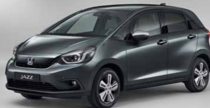
SHINING GRAY METALLIC