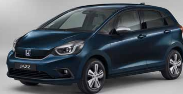
MIDNIGHT BLUE BEAM METALLIC