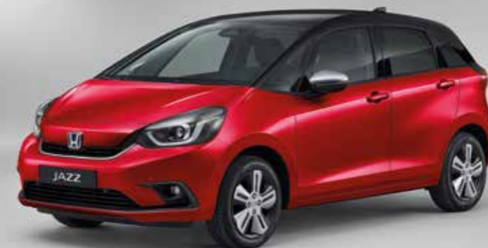
PREMIUM CRYSTAL RED METALLIC / TWO-TONE