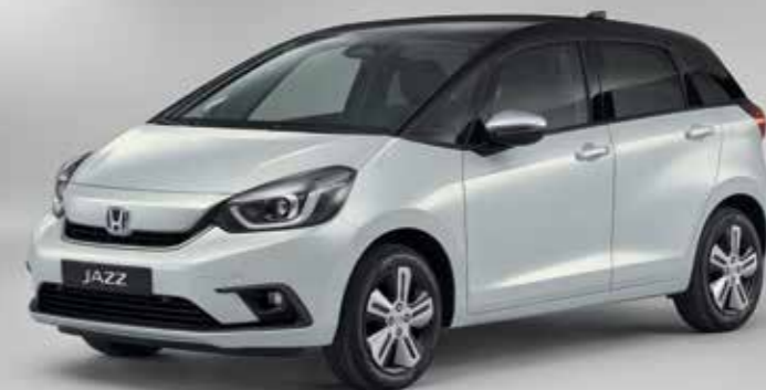
PREMIUM SUNLIGHT WHITE PEARL / TWO-TONE