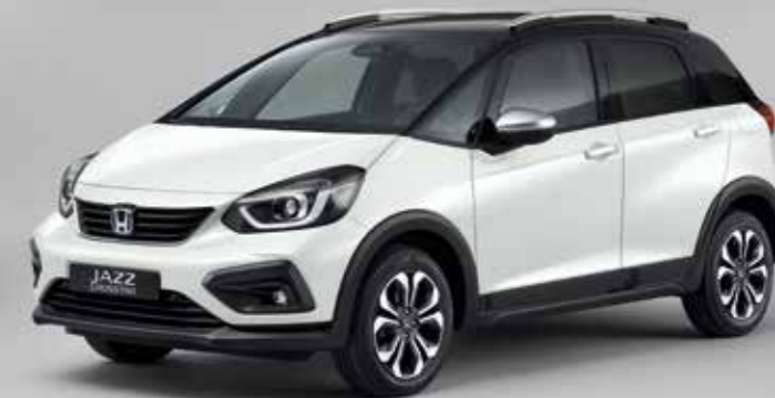
PLATINUM WHITE PEARL / TWO-TONE