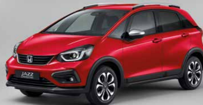
PREMIUM CRYSTAL RED METALLIC