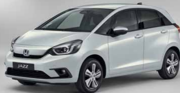
PREMIUM SUNLIGHT WHITE PEARL