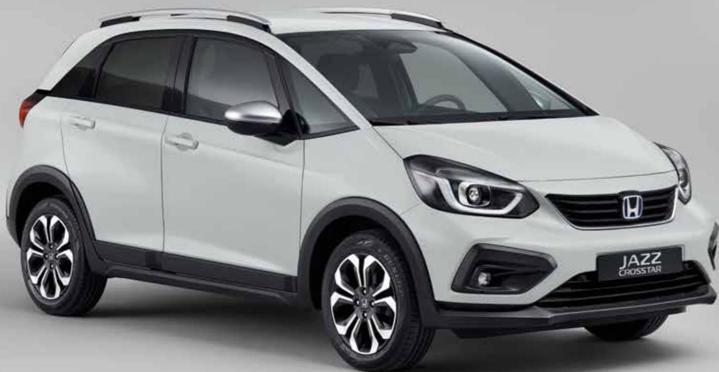
TAFFETA WHITE III

Nya Jazz Crosstar finns i snygga tvåfärgade och enkelfärgade alternativ som drar blicken till sig. Den erbjuds bland annat i en exklusiv Surf Blue. Sätena är stoppade i bekvämt men tåligt vattenavvisande tyg, vilket bidrar till att interiören ser ren och snygg ut, vart du än kör.