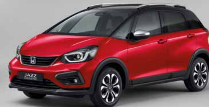
PREMIUM CRYSTAL RED METALLIC / TWO-TONE

Modellen som visas är Jazz Crosstar 1.5 i-MMD Executive. Surf Blue och urvalet av tvåfärgade alternativ erbjuds endast för JazzCrosstar.