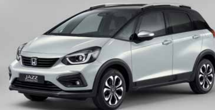
PREMIUM SUNLIGHT WHITE PEARL / TWO-TONE