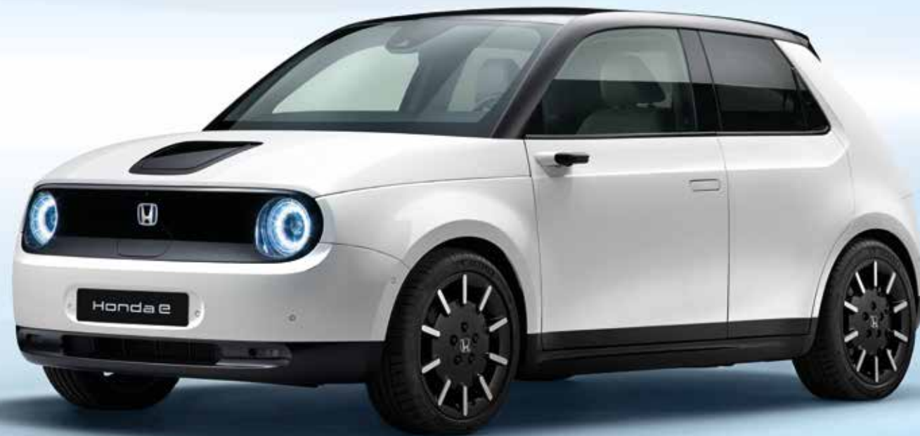
Model shown is Honda e Advance in Platinum White Pearl.