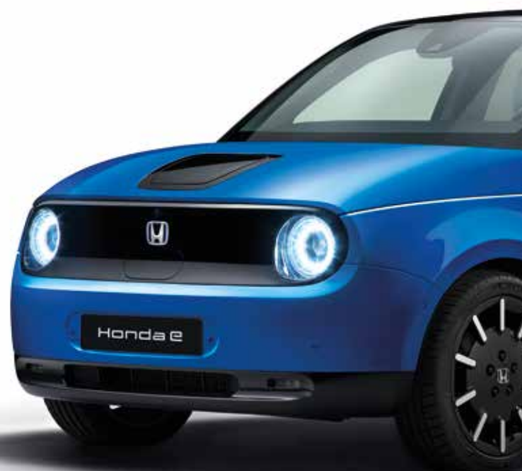
PREMIUM CRYSTAL BLUE METALLIC