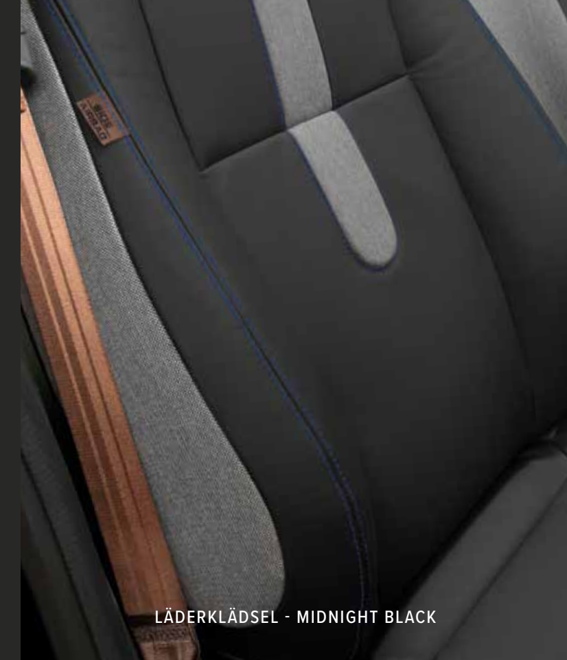
LÄDERKLÄDSEL - MIDNIGHT BLACK

Denna äkta klädsel kommer med Hondas tillverkningskvalitet, hållbarhet och premiumfinish.