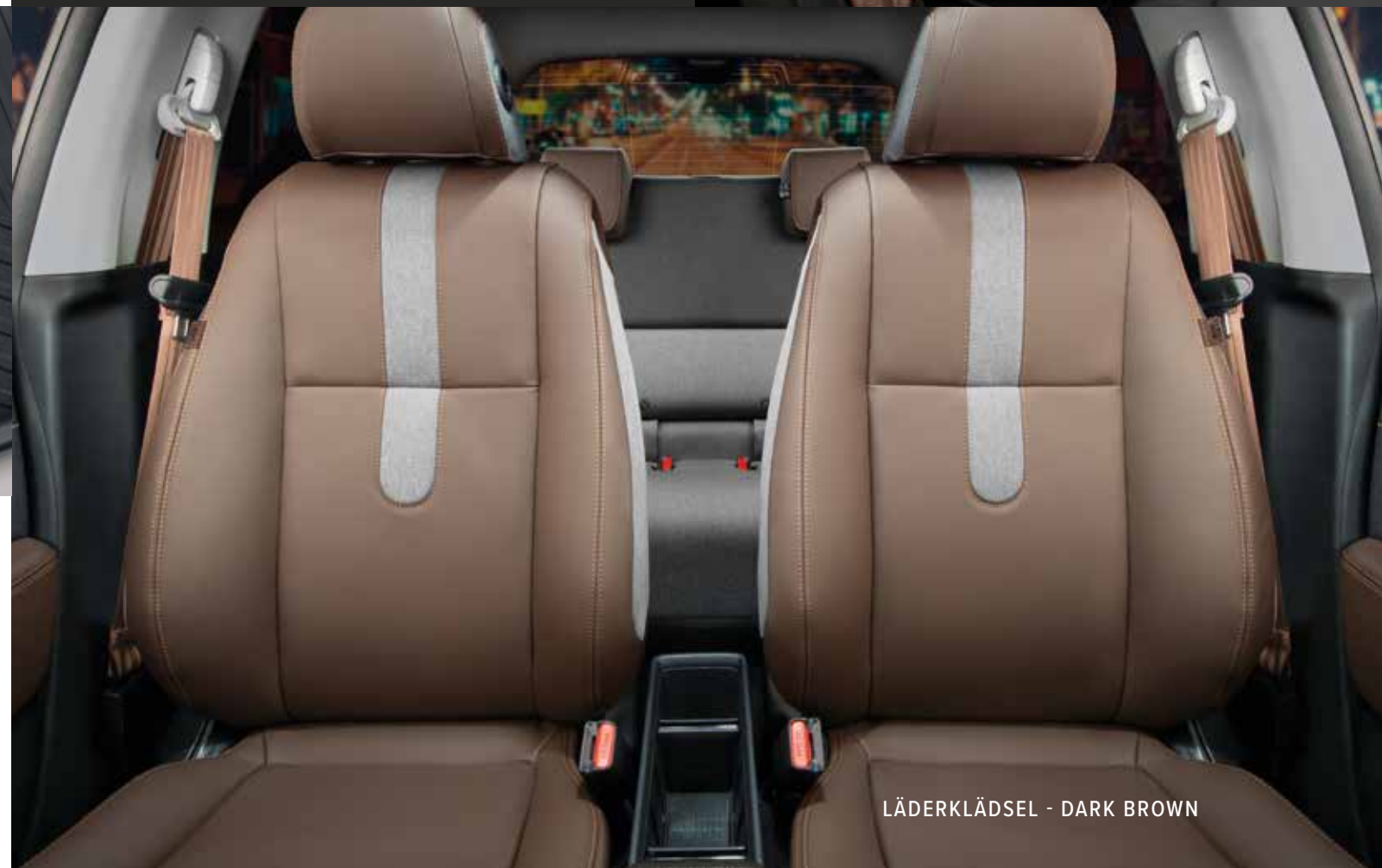
LÄDERKLÄDSEL - DARK BROWN

Detta paket erbjuder maximalt skydd för din Honda e mot livets utmaningar. Paketet innehåller: Vändbar bagagerumsmatta, gummimattor fram och bak, skydd för laddningslocket och skyddsfilm för laddningsporten.