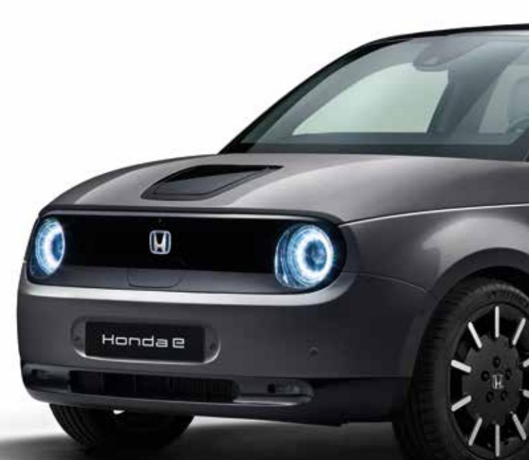
MODERN STEEL METALLIC