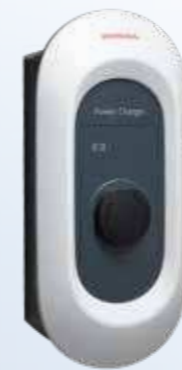
Honda Power Charger S+