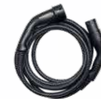
5 X Mode 3-Laddningskablar