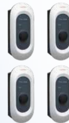
4 x Honda power charger S