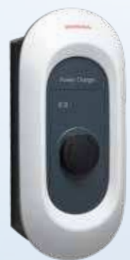
Honda Power Charger S