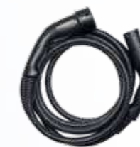
Mode 3- Laddningskabel