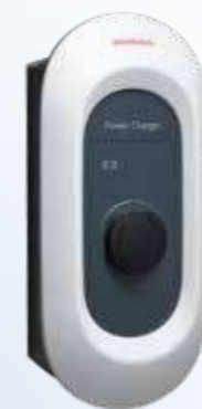
Honda Power Charger S