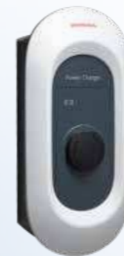
Honda Power Charger