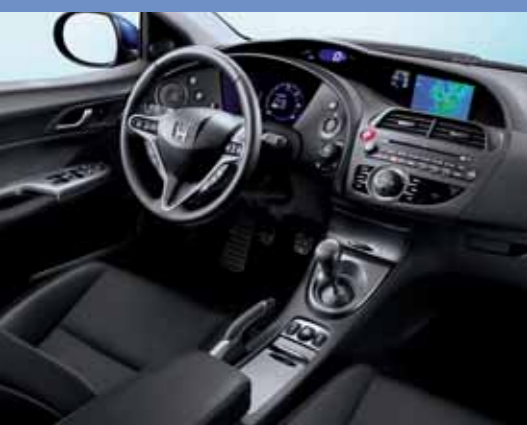
1,8 executive navigation