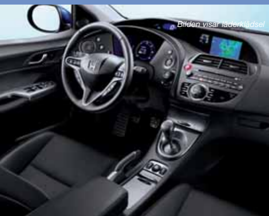
1,8 executive navigation & läder