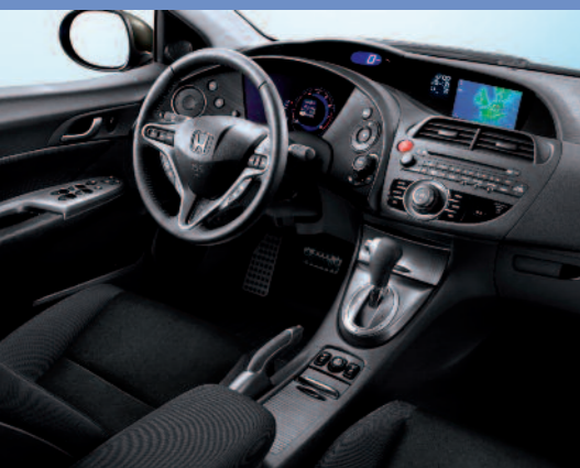
1,8 executive navigation