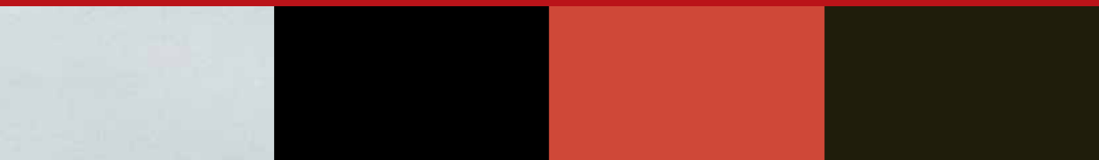
Asbadator Silver Metallic