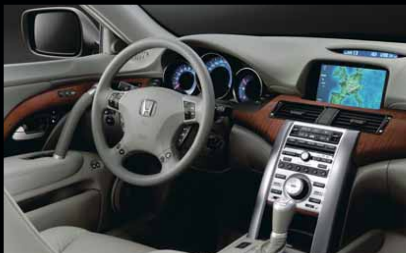
Varmgrått skinn med träpanel