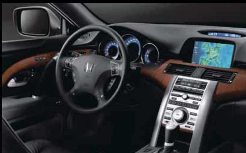
Svart skinn med träpanel