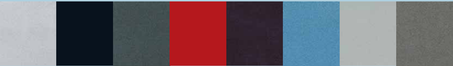
Alabaster Silver Metallic