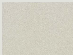
Champagne Silver Metallic