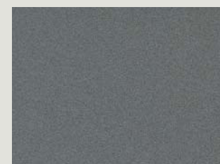
Cosmic Gray Pearl