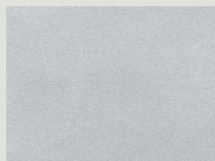
Alabaster Silver Metallic