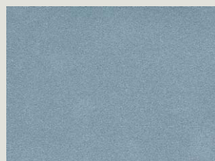
Blueish Silver Metallic