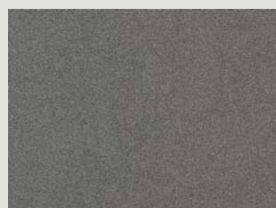
Galaxy Grey Metallic