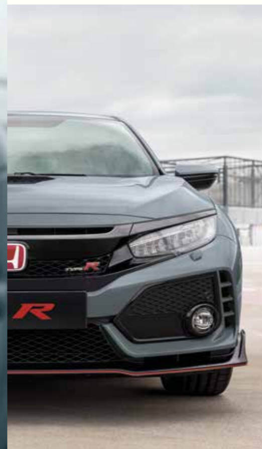
SONIC GREY PEARL