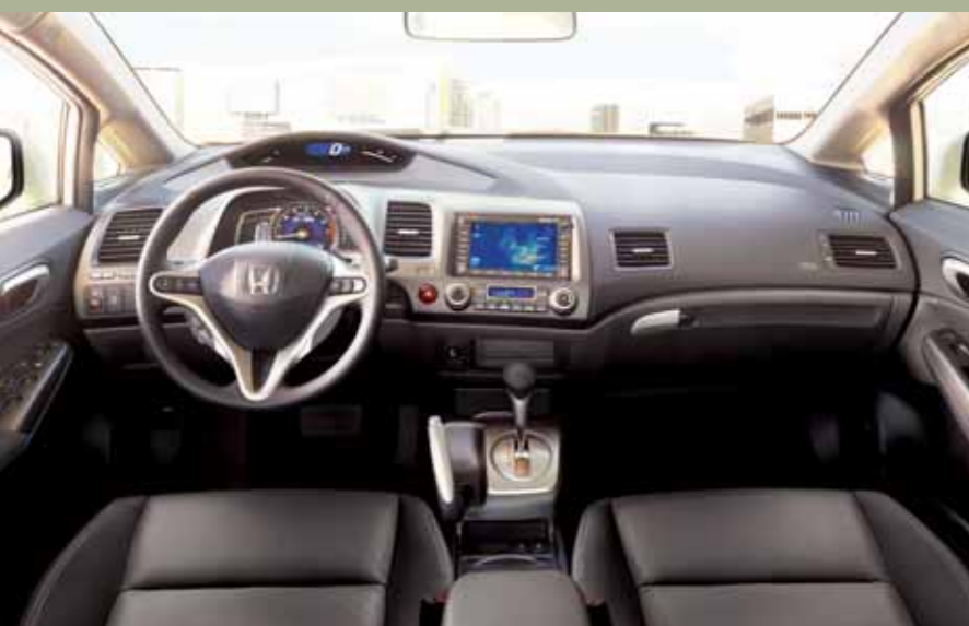
Civic Hybrid - Läder & navigation