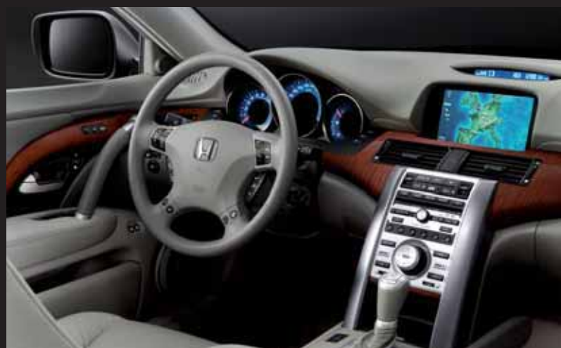
Varmgrått skinn med träpanel