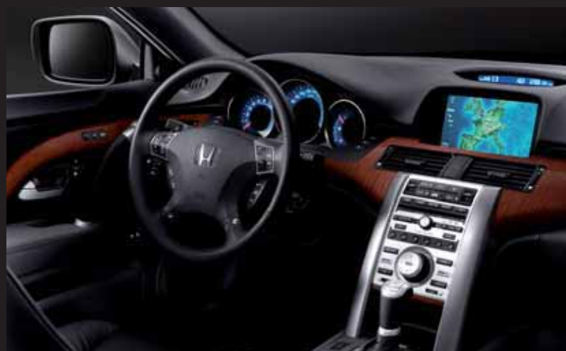
Svart skinn med träpanel