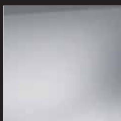
SUPER PLATINUM METALLIC