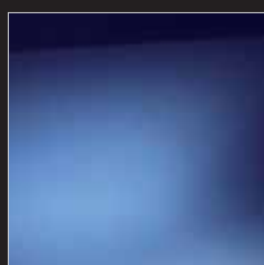
OPULENT BLUE PEARL