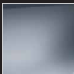
BN MED SILVER METALLIC