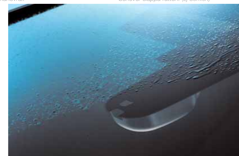
Automatiska vindrutetorkare När de första få dropparna faller på vindrutan startar vindrutetorkarna automatiskt. Sedan är kontrollen din. (Ej Comfort)