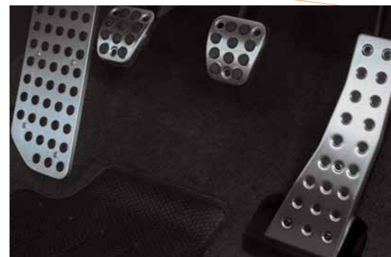
Aluminiumpedaler Pedalerna och fotplattan har en spännande futuristisk stil, helt i enlighet med det övergripande konceptet för Civic. (Ej Comfort)

Kupén i Civic har ägnats lika mycket uppmärksamhet som dess exteriör. Allt är av senaste design och allt fungerar med 100% effektivitet.