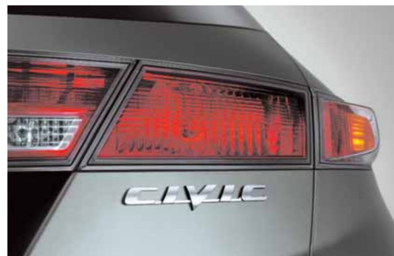
Lykthus bak Långa och smala bakre lykthus matchar karosformen perfekt och sprider ljuset bättre.