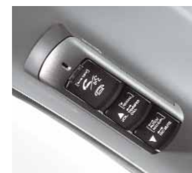
Bluetooth-systemet – den mest innovativa handsfree lösningen för din telefon