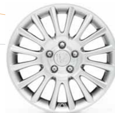
17-tums lättmetallfälgar med imponerande 16 ekrar.

Om du vill plocka ihop ett eget tillvalspaket är urvalet stort till din nya Civic. För mer tillbehör, se broschyren "Honda Civic 5d tillbehör" eller besök www.honda.se