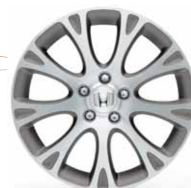
18-tums lättmetallfälgar med modern 9-ekrarsstil. (Endast för modeller med original 17 tums lättmetallfälgar).