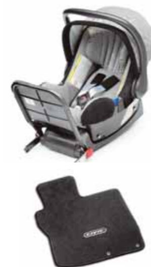
ISOFix barnstol från 0 till 13 kg (0-15 månader) med ISOFix fastsättning