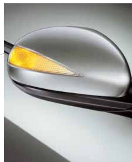
Infällbara ytterbackspeglar De infällbara ytterbackspeglarna har inbyggda körriktningssvisare med en unik triangulär form. Och ju längre körriktningssvisare, desto lättare för andra trafikanter att uppmärksamma.

Kupén i Civic har ägnats lika mycket uppmärksamhet som dess exteriör. Allt är av senaste design och allt fungerar med 100% effektivitet.