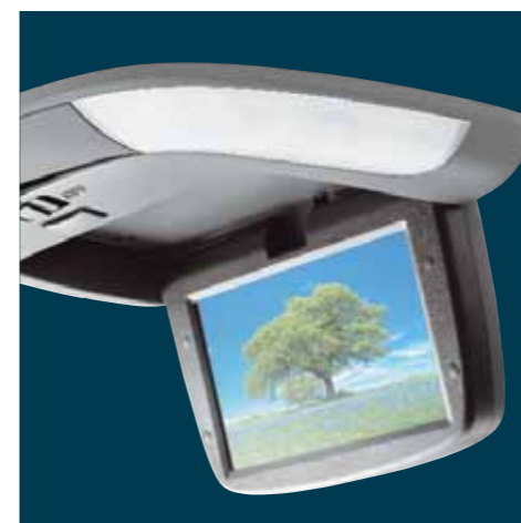
i-VES underhållningssystem med skärm och studioljud i bilen, CD- och MP3-kompatibelt med medföljande hörlurar