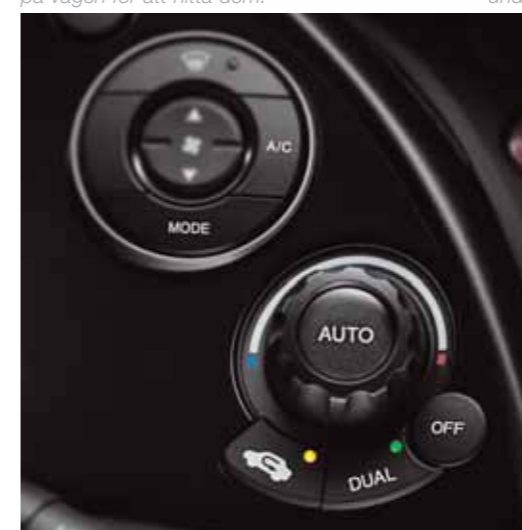
Klimatkontroll Varmt eller kallt på ett ögonblick. Med klimatanläggningen kan förarens och passagerarens miljö ställas in oberoende av varandra. (Endast Executive: har 2-zons klimatkontroll)