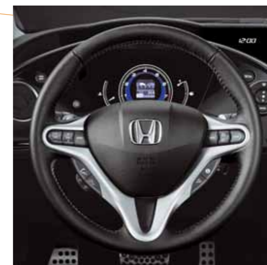
Läderklädd ratt Den snygga 3-krade ratten utgör inget hinder för all viktig information på instrumentpanelen som du har i ditt yttre synfält. Du behöver aldrig ta ögonen från vägen. (Ej Comfort)