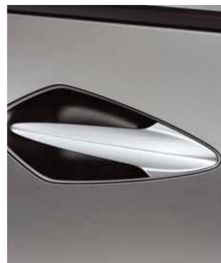
Dörrhandtag fram Infällda, triangulära och säkrare än utskjutande handtag.