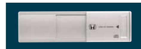
CD-växlare med plats för upp till 8 av dina favoritskivor