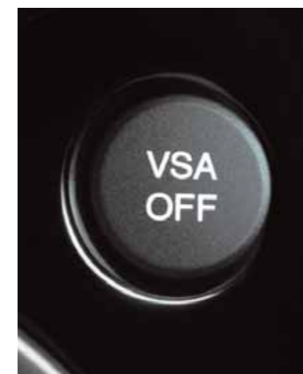
VSA Stabiliseringsystemet VSA hjälper till att hålla kursen vid kurvtagning, acceleration och undanmanövrar.