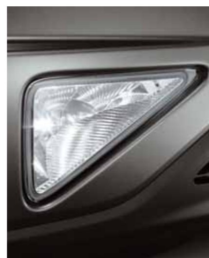
Dimljus fram I den främre stötfångaren finns dimljus som både har en triangulär form och är mycket kraftfulla. (Ej Comfort)