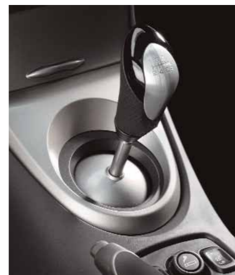
Växelspaxknopp i sportigt perforerat läder och aluminium för både manuella och automatiska växellådor