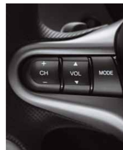
Ljudreglage Ljudreglagen är placerade på den vänstra rattekern. Du behöver aldrig släppa blicken på vägen för att hitta dem.