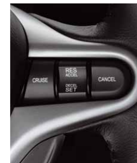
Farthållare På den högra rattekern kan farthållaren ställas in med fingret eller tummen utan att du behöver släppa ratten. (Ej Comfort)