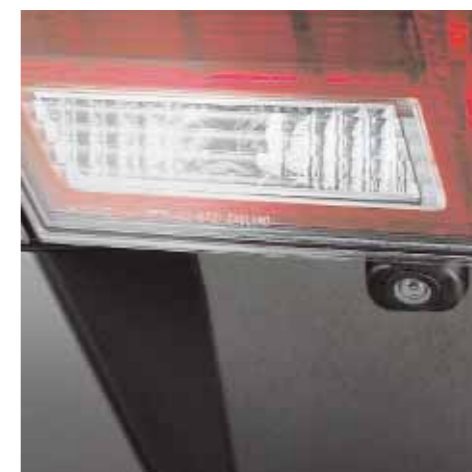
En bakre kamera visar bilder på navigations-skärmen så att du alltid vet vad som finns bakom dig. (Fungerar endast på modeller med fabriksmonterad navigations-skärm).