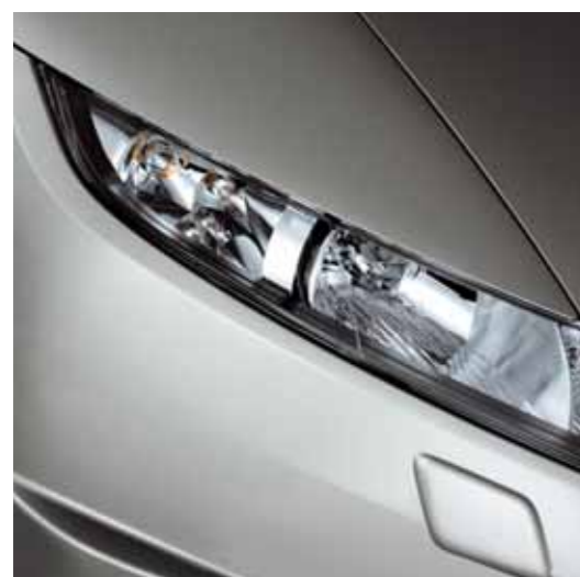
Strålkastarhus fram Långa och vinklade. De avspeglar designidén och ansluter noga till motorhuvens linjer för att förbättra aerodynamiken.