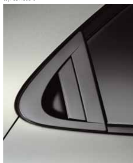
Bakre dörrhandtag Infällda, insmugna vid bakstolparna, finns de diskreta dörrhandtagen som ger en dynamisk 3-dörrarsattityd med 5-dörrarsfunktionalitet.