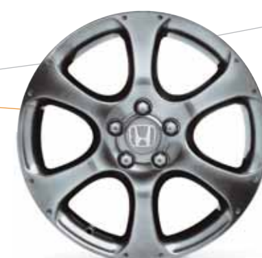
18-tums lättmetallfälgar 6-ekrat utförande i mörkgrått. (Endast för modeller med original 17 tums lättmetallfälgar).