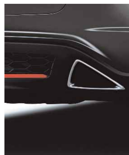
Slutrör Förkromade slutrör, som speglar triangulär temat hos Civic, är spännande både koncept- och funktionsmässigt.