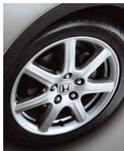
17 tums lättmetallfälgar 17-tums sjukrade lättmetallfälgar förbättrar både utseendet och väggreppet. (Ej Comfort)

Det nya i Civic handlar inte enbart om stora ting, som en fantastisk formgivning och aerodynamik. Det handlar om de små detaljerna också. I varje avseende har varje detalj utvecklats för att både vara estetiskt tilltalande och ha ett praktiskt syfte.