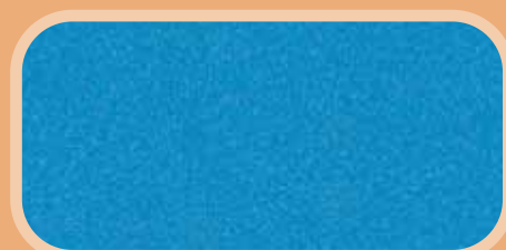
Vivid Blue Pearl