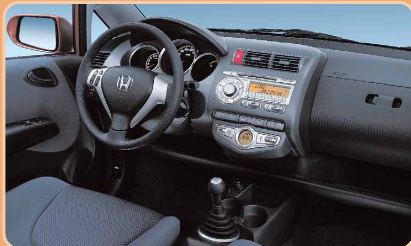
Jazz 1,4 LS manuell