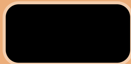
Nighthawk Black Pearl