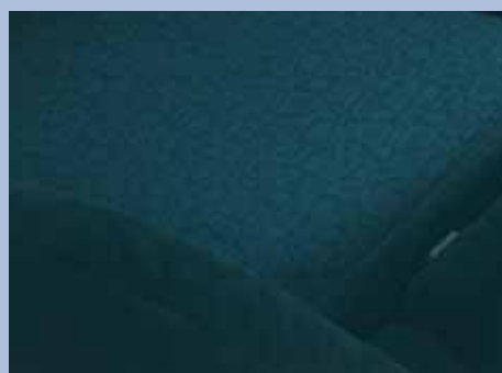
Grå-svart tygklädsel (1,7 Comfort och 2,0 Executive)