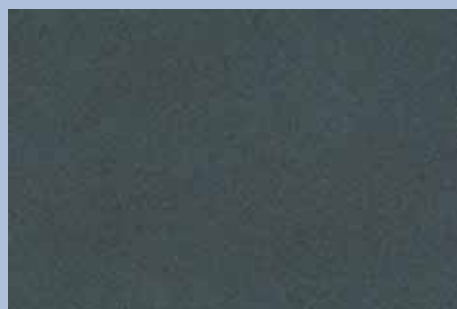
Sparkle Gray Pearl